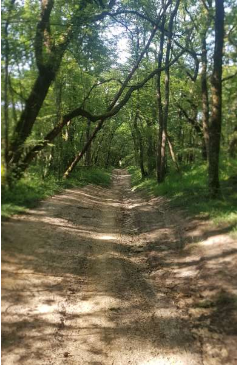
Un beau chemin creux