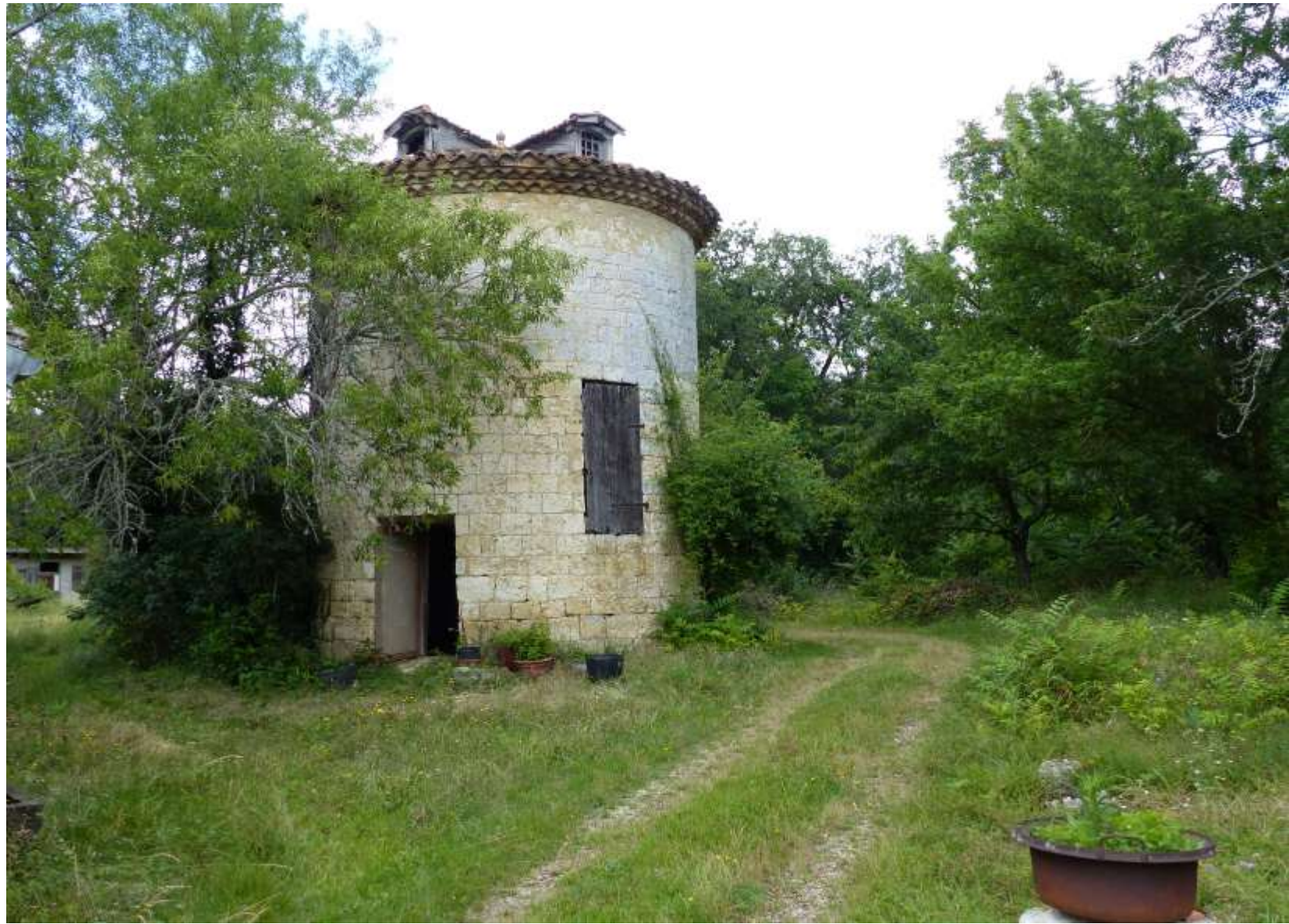
Pigeonnier? sur le chemin