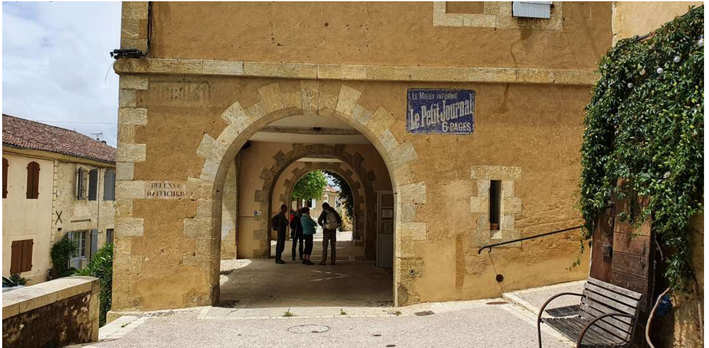
Les arcades de Lavardens, célèbre lieu de pique-nique (pour l'ASRY 85)