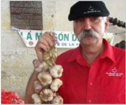
Francis sur un marché